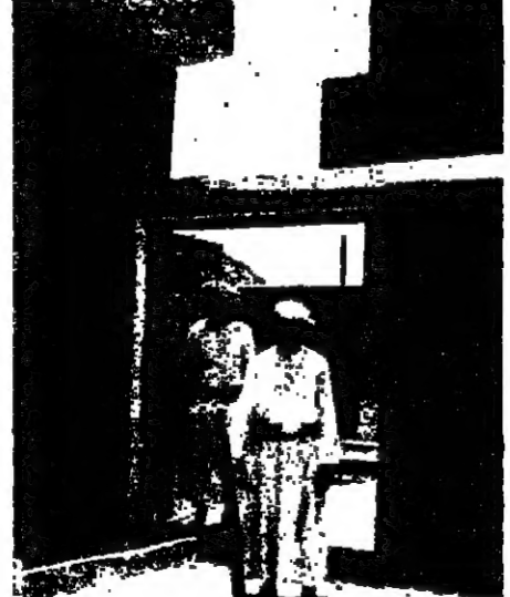
حارس مقر الوالي في «نزوي»

في الداخل يولس الوالي الشيخ محمد احمد الدارتي ( حوالي 22 سنة ) يلبسه التقليدي والخجل في وسطه والى جانبه شيخ وقر يتيه على عمار ريفية وطويلة وشجره محترم ، وفي المجلس ايضا عدد من شيوخ القبائل وجيهمهم يمتزون بشلجرهم .. « اهل .. اهل .. شرحتم » قال الوالي تحدث مينا ببلغة وتواضع ، لم يدخل الوالي مدرسة ولتته تعلم على نفسه ، يعرف كيف يختار الكلبات مثل ديولوجي .. « هاتو باردا .. وجاء اقدمهم يحمل «غلاونا» صفرا وصب لنا ماء .. « هاتوا الخلو » .. وجاء اخر يحمل صنية سفرة عليها صحن صخر في وسطه كتلة مسن الحلوى الصراء اللزجة .. قال الوالي : تفشلوا .. هذه حلوى عمانية هي مزيج من عصع قصب السكر الحلوي واللسين والاور .. ولكن لم يكن هناك ملققة ولا شوكة .. ولا كان الحكم يمنعي من تناول الحلوى فقد قيل الوالي احتذاري مع كلف ، ولكن ريشن الرحلة مطنى خروشي بد اسلمه واكسل والحاضرين .. وسالنا الوالي : ماذا نستطيع ان نזור هنا ؟ قال : القلعة وصنع النور .. غير ذلك ؟ قال : الجبل الأخضر قريب منا ، ولكن لا يمكن الوصول اليه الا بالهيكوبس .. هناك منطقة رائعة يصونها مثل بالانك لبنان .. الله يا ابايما ما اجيك ..